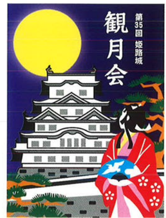
〈オブジェイメージ図〉