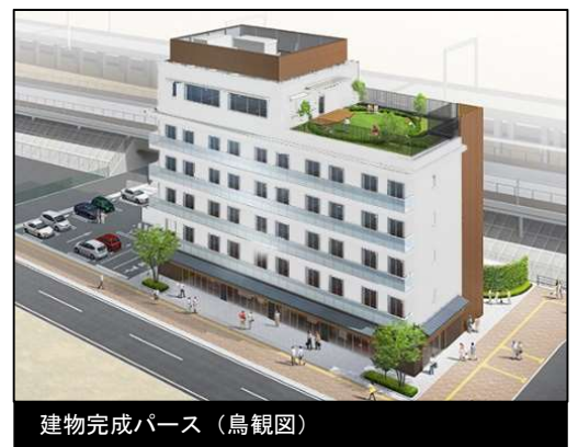
建物完成パース（鳥観図）

この度、姫路市まちづくり振興機構は、JR 東姫路駅周辺のまちづくりを推進するため、同駅に隣接する所有地に、民間が持つノウハウを活用した設計・施工・管理一体のDBO (Design Build Operate) 方式により、サービス付き高齢者向け住宅や店舗等を備えた施設「ペクテリス東姫路」を整備し、落成式を開催します。