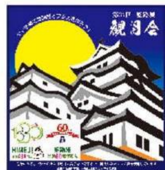
マッチオブジェ 完成イメージ

月観測コーナー 姫路科学館・無料 月の出～21:00まで Moon observation Section (with telescope)