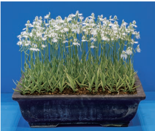
姫路市長賞 村上 育男様