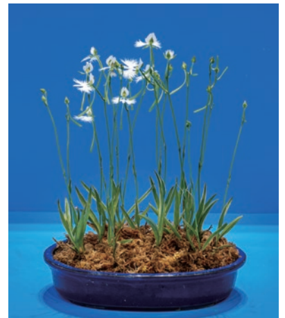
姫路教育長賞 姫路市立安室東小学校