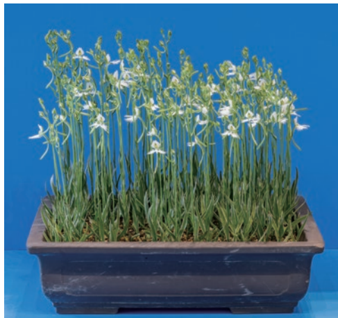
姫路市議会議長賞 山口 由美子様