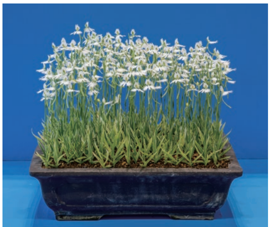
神戸新聞社賞 村上 京子様