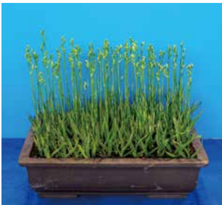
神戸新聞社賞 山口 由美子様