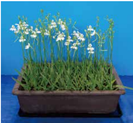
姫路市長賞 廣岡 禮子様