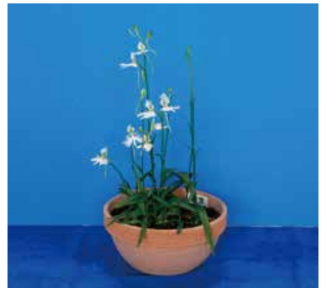
姫路市教育長賞 姫路市立書写中学校