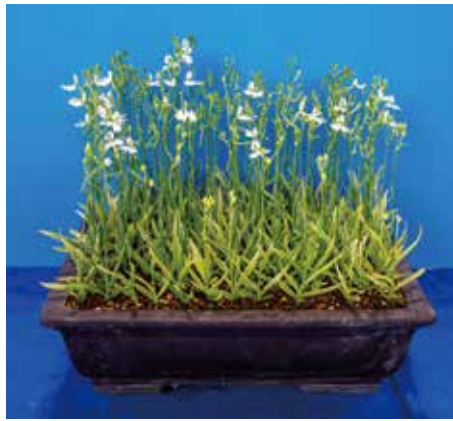
姫路市議会議長賞 村上 育男様